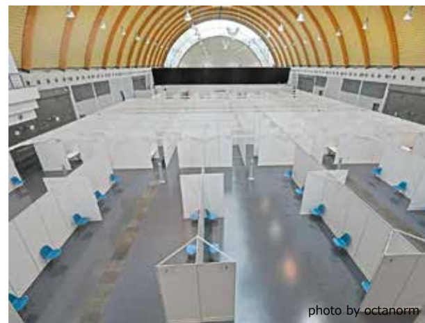
<ワクチンセンター in ノルトライン・ヴェストファーレン州>