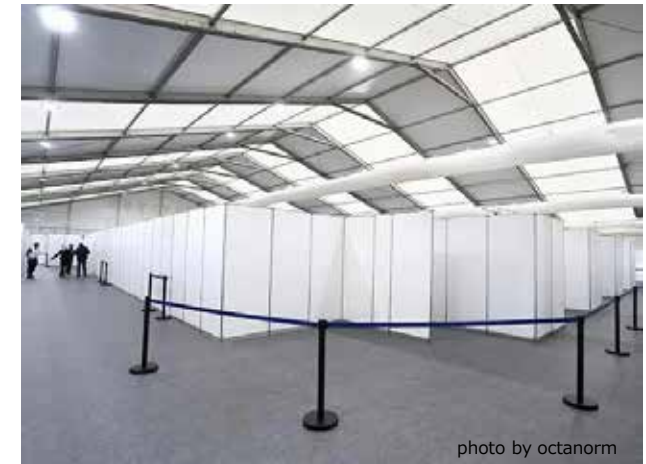
<ワクチンセンター in ヴェルツブルク> ※仮設テント内にて設営

イベントや展示会で使用される“システムパネル”を利用して、通路や個室等の間仕切りを施し、受付から、待合、接種、等の一連の工程において、緻密な導線計画をとり入れた会場レイアウトを施すことで、結果的に安全で効率的なセンターの運営を可能にしています。