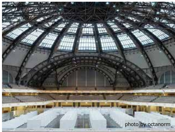
<ワクチンセンター in ドイツ ヘッセン州>

海外では、ワクチンセンターとして、主に体育館、展示会場、コミュニティホール、テニスコート、サッカー場、ホテル、コンサート会場などを利用して設置されています。