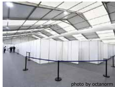
【大型テント内レイアウトイメージ】