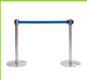
会場誘導資材 各種

適用床面積：31畳 ストリーマーの分解力とアク ティブプラズマイオンのダブル 方式